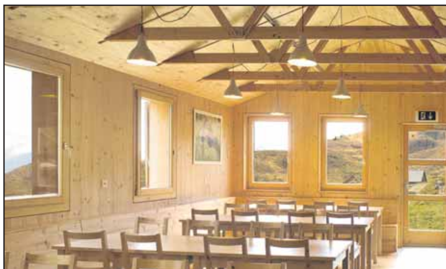
Avec ses fermettes apparentes au plafond, le réfectoire bénéficie d'une généreuse lumière naturelle.