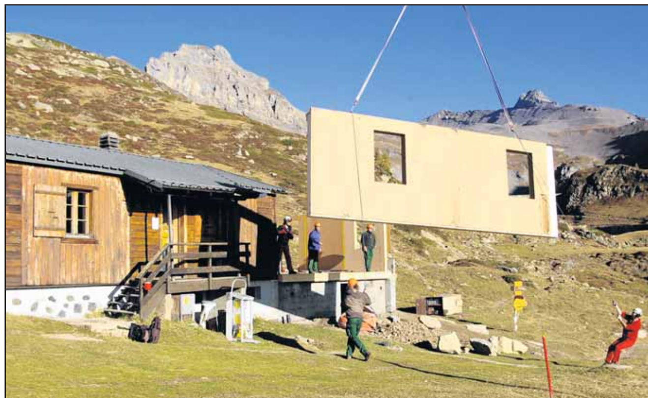
Les façades préfabriquées en bois ont été hélicoptées jusque sur le chantier. LEONARD BENDER

L'idée était donc de réaménager complètement l'intérieur en «tournant» la cabane sur elle-même, pour orienter la